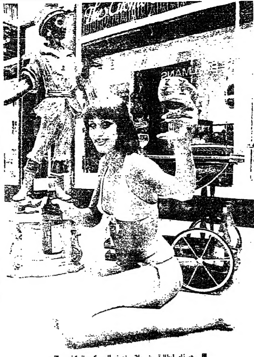
حسنا ايطالية من مملكو تعرض الويسكي بالبمشي